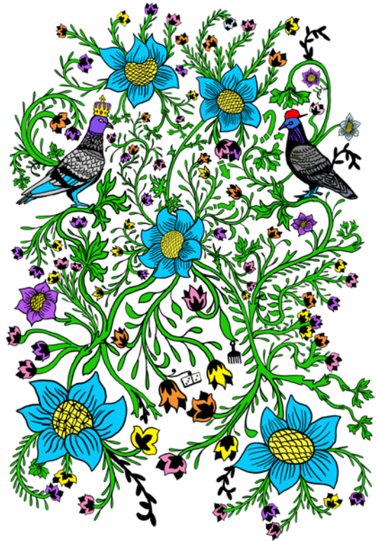
ilustración digital

Roberto Lugo (puertorriqueño estadounidense, n. 1981)